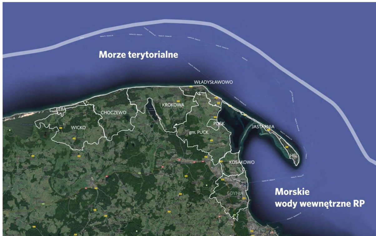
Rysunek 1. Gminy Nadmorskiego Obszaru Usługowego